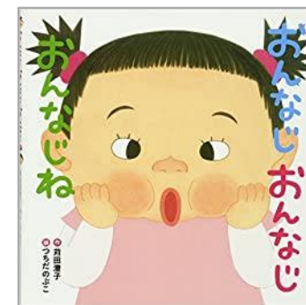
「おんなじおんなじおんなじね」 荻田 澄子/文 つちだ のぶこ/絵 (学研)

「おんなじ」ってすてきだよ。みいちゃんのおめめやおはな、おくちもほっぺも…おかあさんやおとうさん、おばあちゃんたちといっしょだね♪